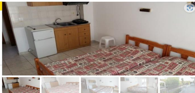
Студио бр.103(прв кат)

Студиото располага со три поединечни кревети, тв, клима уред, кујна комплетно опремена со кујнски инвентар, аспиратор, фрижидер, купатило со вц. Од студиото се излегува на тераса со маса и столици. Во студиото може да се вметне дополнителен кревет на расклопување за дете до 12 години.