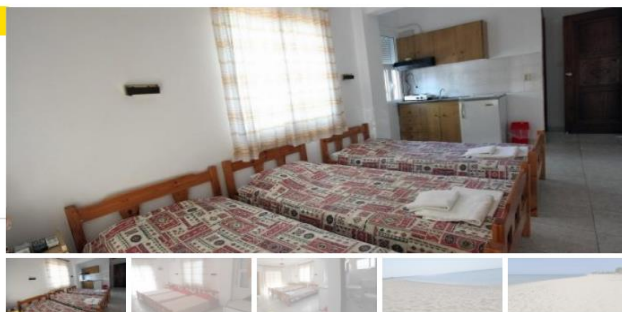
Студио бр.102(прв кат)

Студиото располага со еден дупол кревет и еден поединечен кревет, тв, клима уред, кујна комплетно опремена со кујнски инвентар, фрижидер, купатило со вц. Од студиото се излегува на тераса со маса и столици. Во студиото може да се вметне дополнителен кревет на расклопување за дете до 12 години.