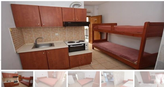
Студио Б13(втор кат)