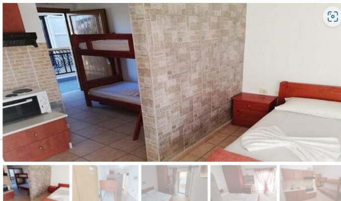
Студио В6 (прв кат)

Студиото располага со една просторија раздвоена со зидана преграда.Во склопот на истата просторија е кујната.Кујната е комплетно опремена со кујнски инвентар, голем фрижидер,шпорет со фурна,аспиратор.Има еден дупол кревет комотен за спиење на две лица и два единечни кревети на спрат комотни за спиење на 2 лица, плакар за алишта, клима уред ,ТВи излегува на тераса.На прозорите има комарници и на терасите има тенди. Од студиото се излегува на тераса со маса и столци.Студиото располага со стандардно купатило и вц.