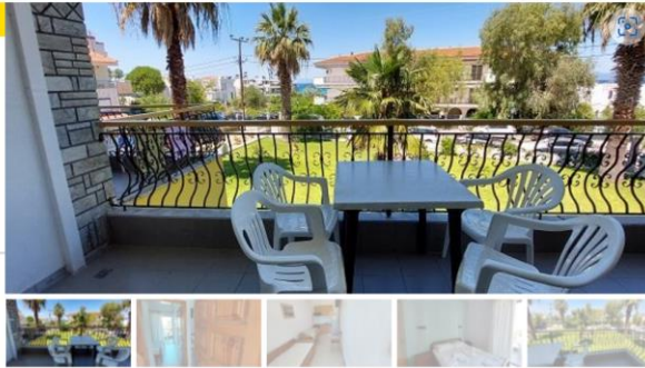
Апартман бр.9(прв кат)