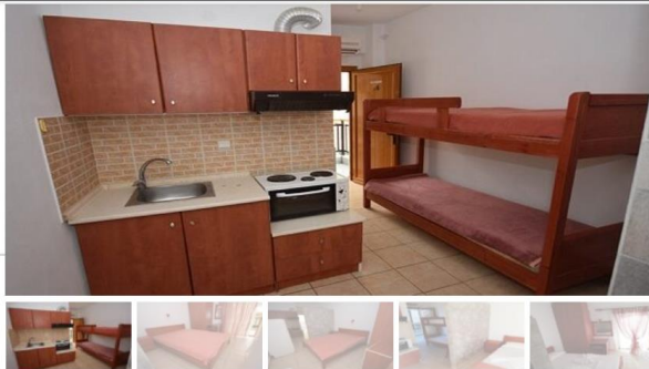
Студио Б13(втор кат)

Апартманот располага со две простории.Во првата просторија има еден дупол кревет комотен за спиење на две лица,плакар за алишта,тв,клима уред и излегува на тераса.Во втората просторија е кујната која е комплетно опремена со кујнски инвентар ,голем фрижидер ,шпорет со фурна и аспиратор.Во кујната има два кревети од кои едниот е стандарден , а другиот е на извлекување од под стандардниот кревет. Од апартманот се излегува на тераса со маса и столици и има поглед према море .Апартманот располага со стандардно купатило и вц.