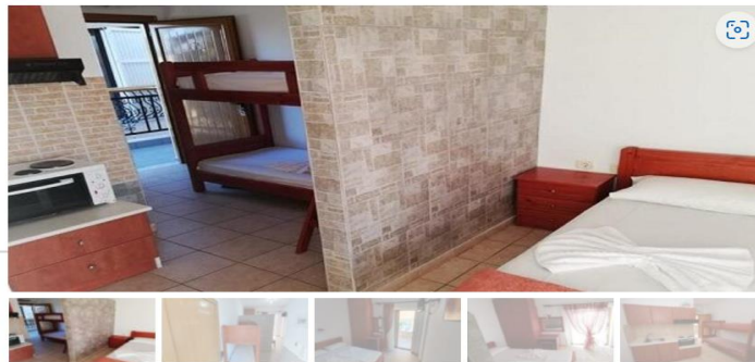
Студио В6 (прв кат)

Студиото располага со една просторија раздвоена со зидана преграда.Во склопот на истата просторија е кујната.Кујната е комплетно опремена со кујнски инвентар, голем фрижидер,шпорет со фурна и аспиратор.Има еден дупол кревет комотен за спиење на две лица и два единични кревети на спрат комотни за спиење на 2 лица, плакар за алишта, клима уред ,ТВи излегува на тераса.На прозорите има комарници и на терасите има тенди. Од студиото се излегува на тераса со маса и столици.Студиото располага со стандардно купатило и вц.