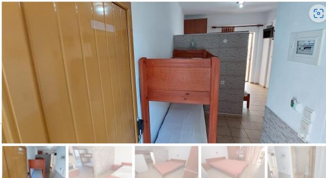
Студио В1 (приземје)