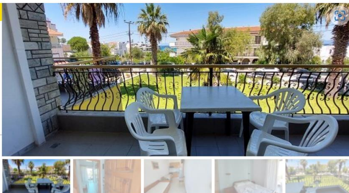
Апартман бр.9(прв кат)

Студиото располага со една просторија раздвоена со зидана преграда.Во склопот на истата просторија е кујната.Кујната е комплетно опремена со кујнски инвентар, голем фрижидер,шпорет со фурна и аспиратор.Има еден дупол кревет комотен за спиење на две лица и два единечни кревети на спрат комотни за спиење на 2 лица, плакар за алишта, клима уред ,ТВи излегува на тераса.На прозорите има комарници и на терасите има тенди. Од студиото се излегува на тераса со маса и столици.Студиото располага со стандардно купатило и вц.